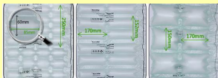
四連排 小雙排 大雙排