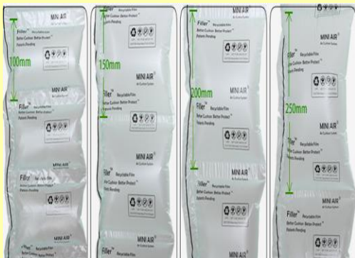
Filler 20*10 Filler20*15 Filler 20*20 Filler20*25