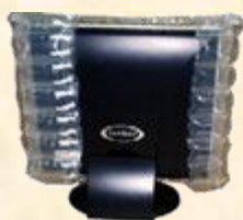
OPEN Q 袋