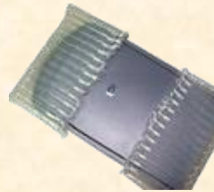
氣柱包裝所占空間少

不管是用於填充空間還是緩衝，緩衝氣柱包裝都可以提供最大的保護效果。比較起其他的緩衝包材，緩衝氣柱包裝多了可以與貨品的外型緊貼的功能，因而可以防止貨品在運送時因震動產生摩擦損壞。