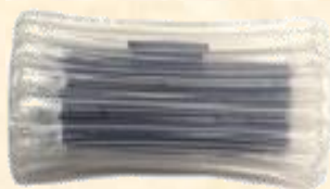
內折 U 袋