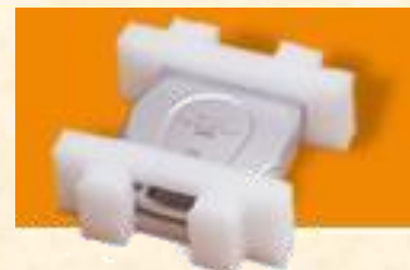
其他發泡包裝空間大