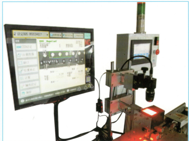
滾輪設備聯動方式：Roller Equipment linked manner