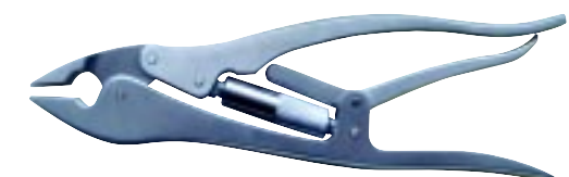
15023-024 大力钳 (M9) Power Grip (M9)