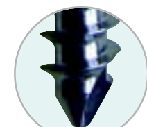
头部自攻槽设计 Self-tapping Screws