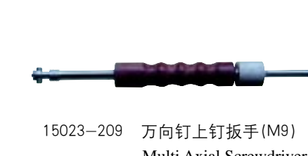
15023-209 万向钉上钉扳手 (M9) Multi Axial Screwdriver (M9)