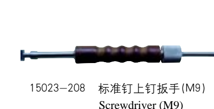
15023-208 标准钉上钉扳手 (M9) Screwdriver (M9)