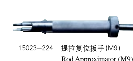
15023-224 提拉复位扳手 (M9) Rod Approximator (M9)