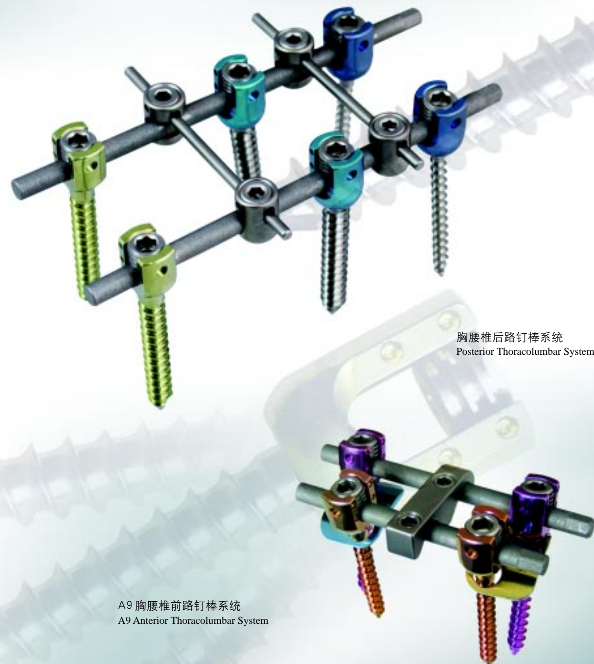
胸腰椎后路钉棒系统 Posterior Thoracolumbar System