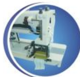
帶後剪刀 After scissors