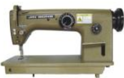
JG-530 人字機 Zigzag sewing machine