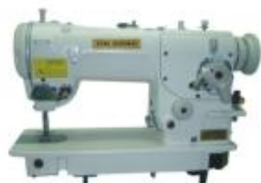
JG-2284 人字機 Zigzag sewing machine