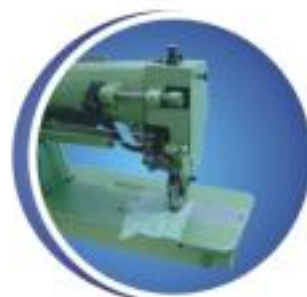
帶後剪刀 After scissors