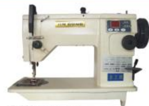
JG-510 百蝶花式機 100 patterns zigzag machine

特点: 本机是在高速平缝机的基础上增加了电脑控制系统的多种功能, 是追求高速度、高质量缝制, 实现高效率加工的机电一体化单针平缝机, 主要功能是有自动停线, 自动倒缝, 因而大大地提高了工作效率, 保证了缝制品的高质量要求。该机外型新颖、大方, 内部结构设计合理, 其关键部分的设计都是以使用方便、获得最佳效果为目的。其先进的控制系统不仅外观设计漂亮, 而且操作方便。