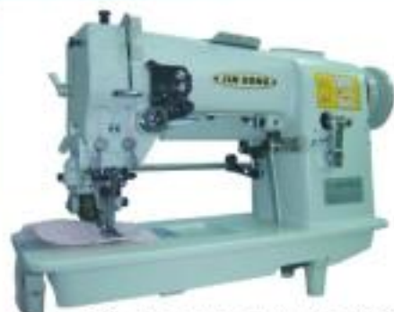
JG-1721PK 對絲機 (帶後刀加指輪) Picoting machine