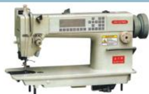
JG-8211-D3 高速自動剪線平縫機 High speed lockstitch sewing machine with automatic thread trimmer

特点: 本机是在高速平缝机的基础上增加了电脑控制系统的多种功能, 是追求高速度、高质量缝制, 实现高效率加工的机电一体化单针平缝机, 主要功能是有自动停线, 自动倒缝, 因而大大地提高了工作效率, 保证了缝制品的高质量要求。该机外型新颖、大方, 内部结构设计合理, 其关键部分的设计都是以使用方便、获得最佳效果为目的。其先进的控制系统不仅外观设计漂亮, 而且操作方便。