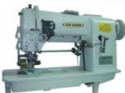
JG-1721K 對絲機 Picoting machine