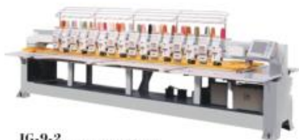
JG-9.2 JG-6.2 單多頭電腦繡花機 Multi-head computerized embroidery machine