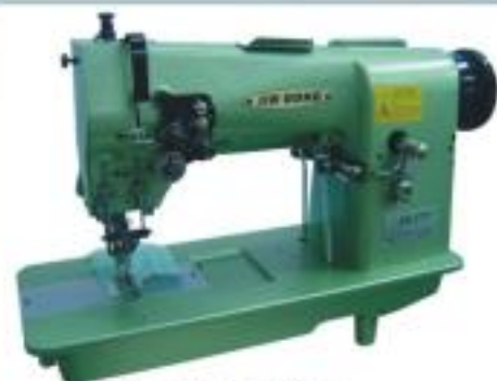
JG-1721 對絲機 Picoting machine