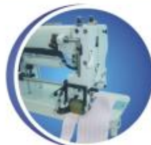
帶後剪刀 After scissors