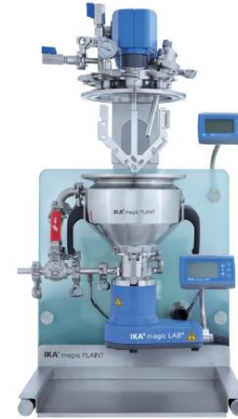
世界领先的研发设备 德国IKA公司MagicPlant系统