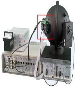
世界领先的检测设备